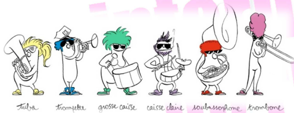
tuba trompette grosse caisse caisse claire saxophone trombone